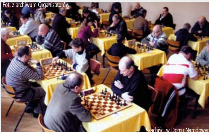
Szachiści w Domu Narodowym